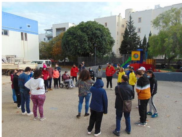
Proyecto de Igualdad de Género. Maratón hacia la igualdad.