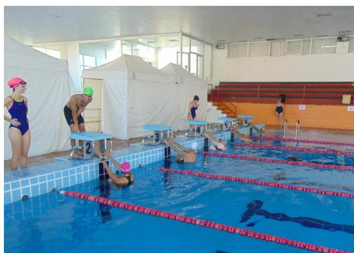
Actividades deportivas adaptadas (natación)