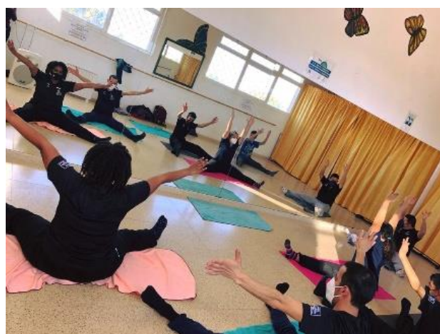
Actividades de deporte adaptado (danzaterapia).