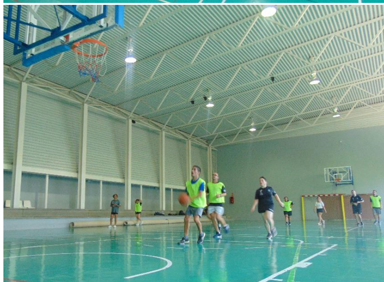
Actividades deportivas adaptadas (baloncesto)