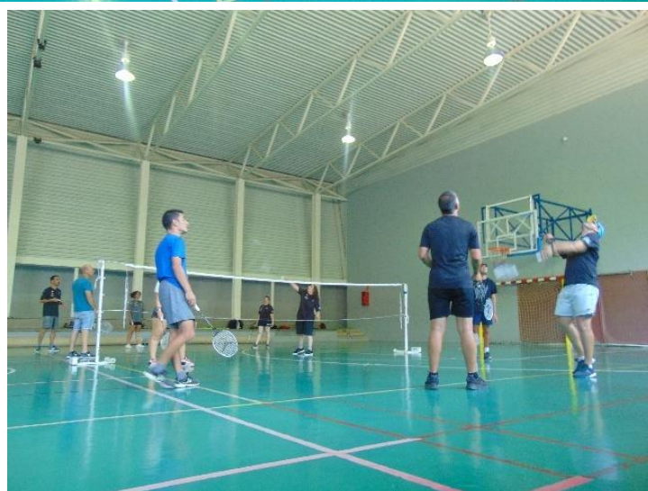
Actividades deportivas adaptadas (bádminton)