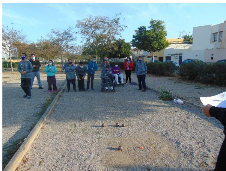
Actividades deportivas adaptadas (petanca)