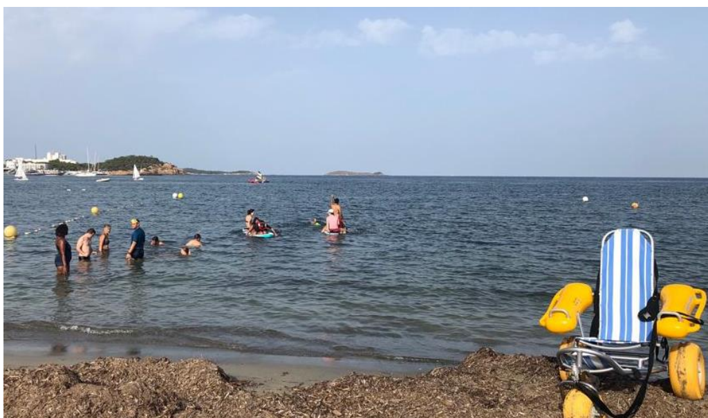
Actividades de deporte adaptado (kayak y vela).