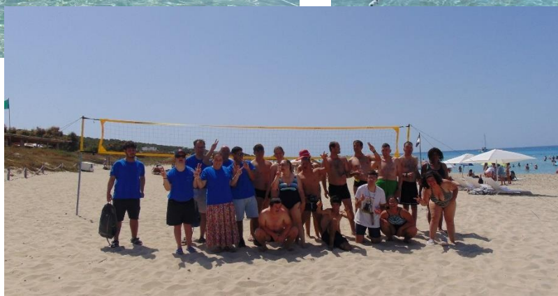
Fotografías de las actividades vóley playa y paddle surf en Formentera (16 al 19/6/2022)