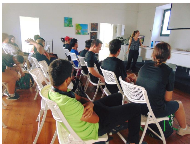
Talleres de igualdad de género a través de la Oficina de igualdad del Ayuntamiento de Ibiza.