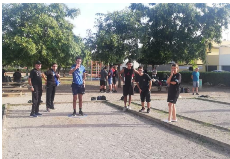
Jornada de petanca inclusiva entre el alumnado del curso superior en actividades físico-deportivas del IES Algarb y ADDIF