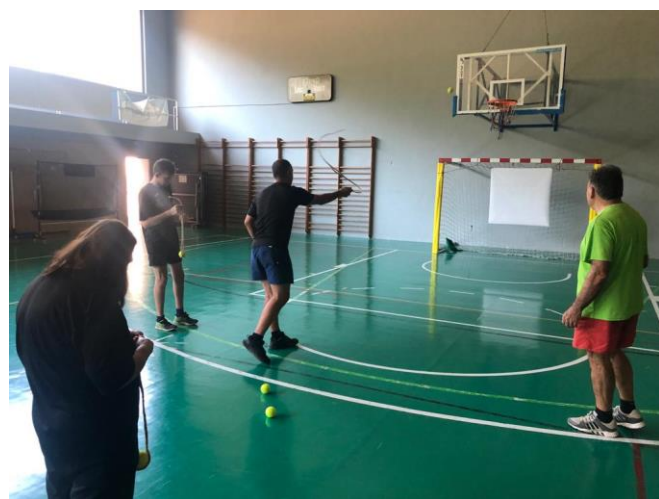
Actividades deportivas adaptadas (tir amb bassetja)