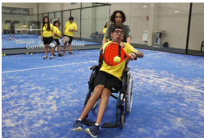
Actividades de deporte adaptado (pádel).