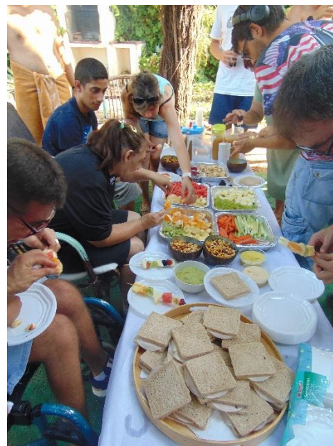
Taller de nutrición y hábitos saludables.