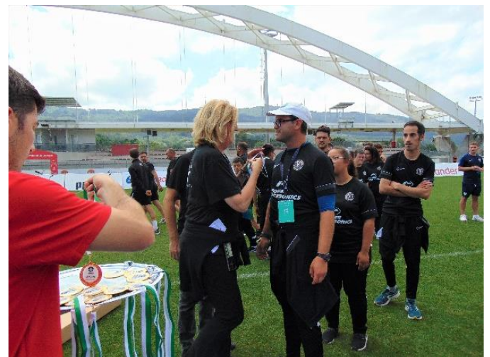
Participación en LaLiga Genuine Santander