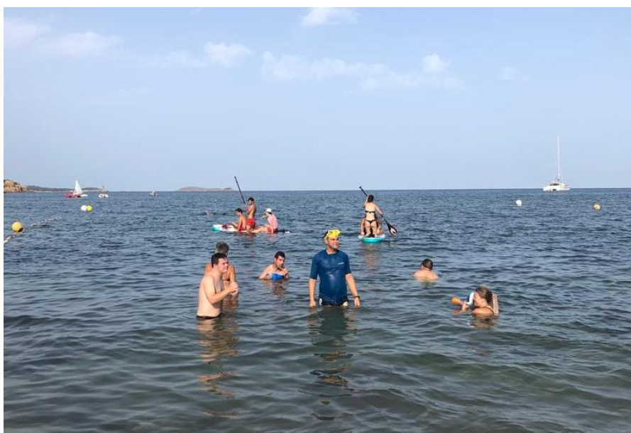
Actividades de deporte adaptado (paddle surf, vóley playa y snorkel).