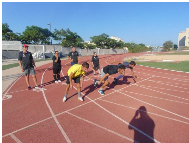
Actividades deportivas adaptadas (atletismo)