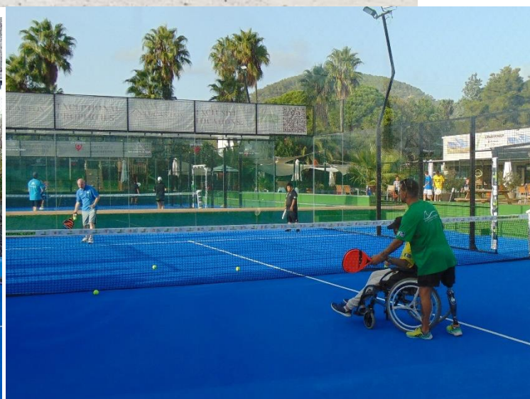
Jornada inclusiva de pádel de la Asociación de Voluntarios de Caixabank con ADDIF