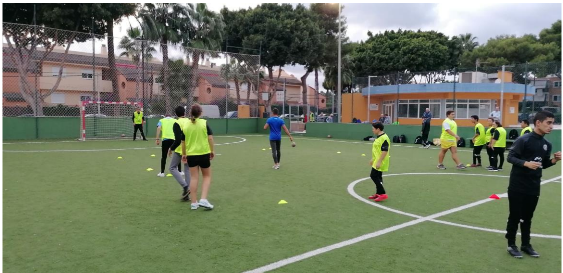
Actividades deportivas adaptadas (fútbol)